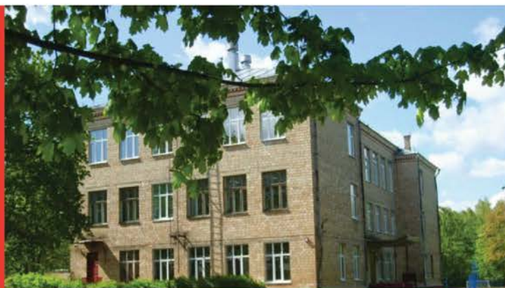
ГБОУ Г. МОСКВЫ “ШКОЛА №448”