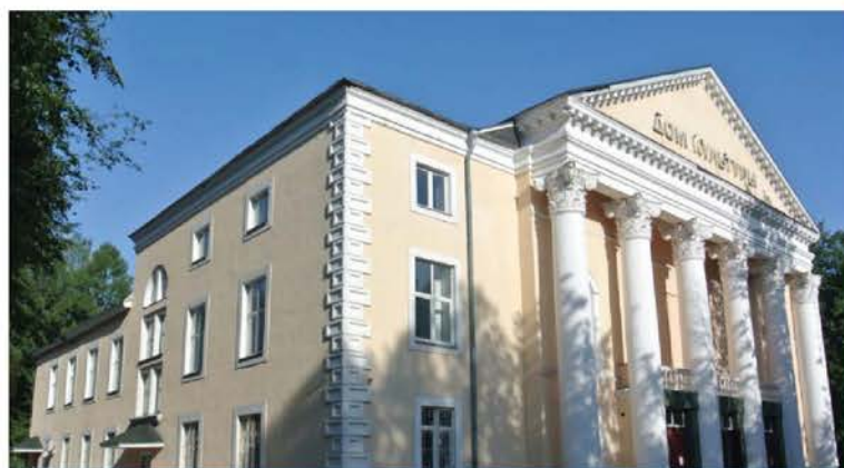
ДОМ КУЛЬТУРЫ “ПУШКИНО”

13 платных клубных формирований, 12 бесплатных