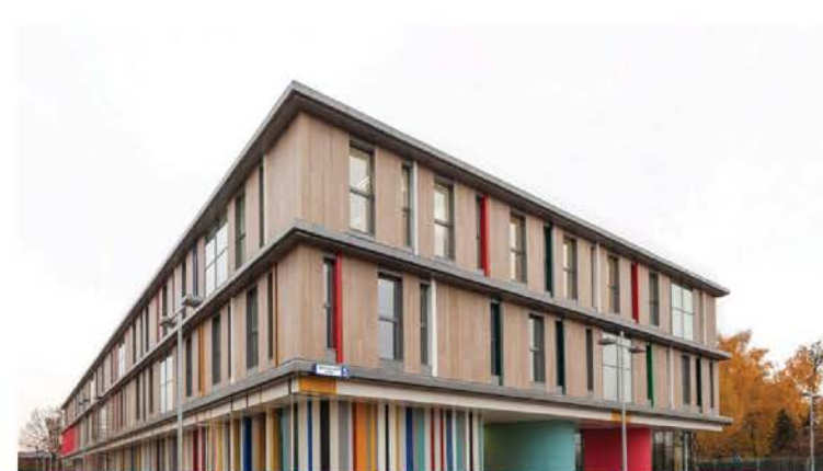
ГАУК МО “МГУБ”

13 платных клубных формирований, 12 бесплатных